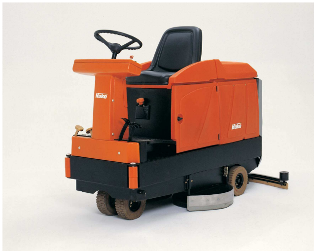
Stroj Hakomatic B 910 (brez predpometalne ščetke)