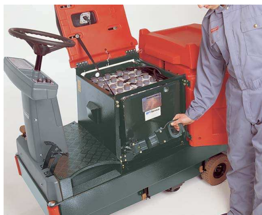
Dobro dostopen baterijski sistem z dodatno hitro menjalno napravo (opcijsko)

Način delovanja Hakomatic B 910 s s predpometalno ščetko: čistilna raztopina vode in čistil je speljana od membranskega rezervoarja do kontra rotirajočih ščetk in nato posesana s parabolno oblikovano sesalno šobo. Predpometalna ščetka dodatno pobira smeti in olajša delo rotirajočim ščetkam. Takšno čiščenje je optimalno in je produkt večletnih HAKO raziskav.