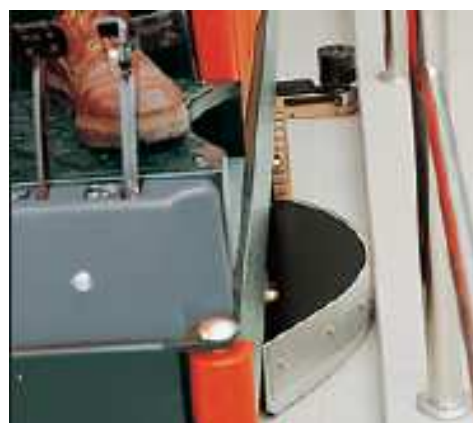
Hakomatic B 910 lahko z obema ščetkama in sesalno šobo doseže vsak rob in ga očisti