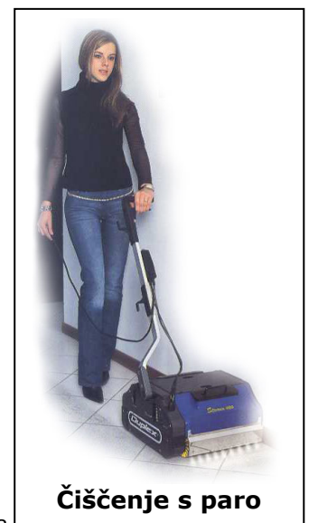
Čiščenje s paro